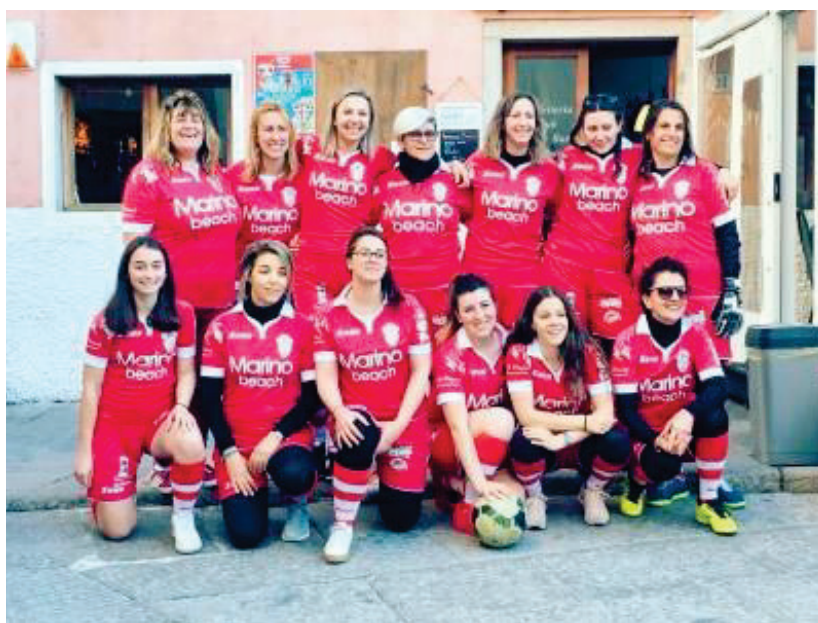
( Atletico San Piero )