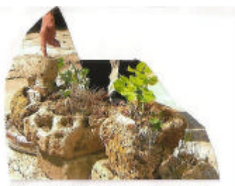
Biovaso a forma di cuore con funzione a serbatoio

Ulteriore risparmio si deve e si può ricavare dalla giusta scelta del lavoro: ciò si