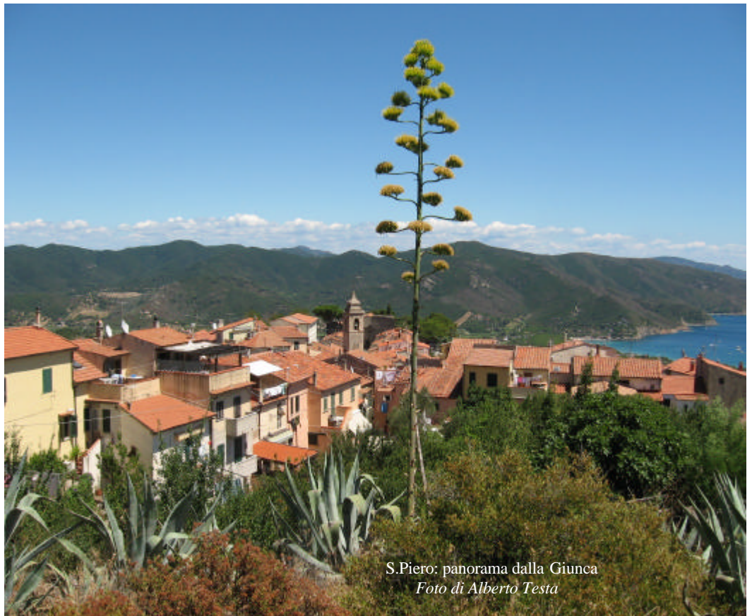
S. Piero: panorama dalla Giunca

L'Estate sta scivolando gradualmente verso l'epilogo annunciato dal ridursi delle giornate e dall'attenuarsi della temperatura. Molte residenze si sono chiuse e le loro luci non traspaiono più dalle finestre, le grida e gli schiamazzi dell'allegria vacanziera tacciono. Rimane comunque lo splendore di giornate azzurre e soleggiate che invitano ancora alla spiaggia. Contribuisce a farci sentire vivi lo scalpito dei gitanti stranieri che arrivano a San Piero per il trekking in montagna o per visitare il Paese. Lentamente ritorneremo