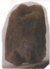
Biovaso a Funzione

In precedenti articoli su questo giornale, ho già suggerito alcuni consigli, dati dal ricercatore F. Sculli, in merito alla casa, all'alimentazione, al lavoro; ora intendo entrare nei maggiori dettagli: per