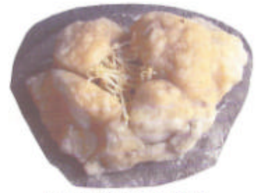
Biovaso Serbatoio in forma a Geode

R.C., Castelli romani (v. dei Laghi); in compenso reperite le pietre, si possono preparare in modo facile per conto proprio: con un punteruolo si svuotano (non andare a caso). I