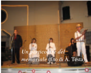
Un particolare del memoriale